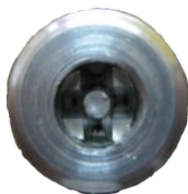
Btype カラー 使用后・背面