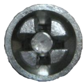
Atype カラー 使用后・背面